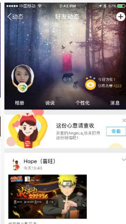
手Q结合版好友动态运营banner