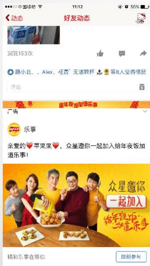
移动端品牌页卡图文feeds