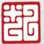
中关村大数据产业联盟