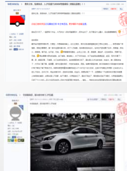
音频传播产品卖点