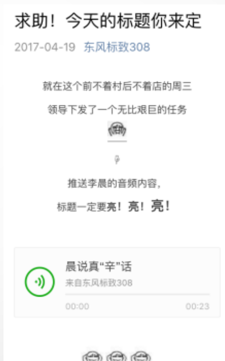
音频传播产品卖点