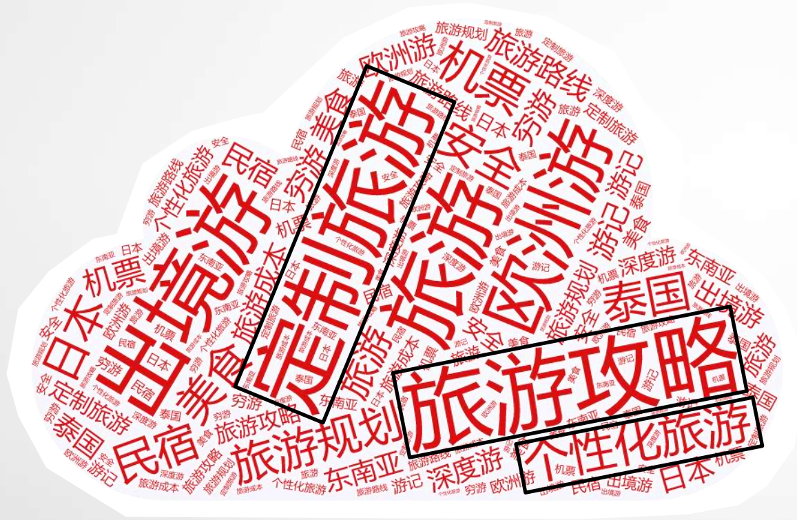
旅游类文章阅读关键词