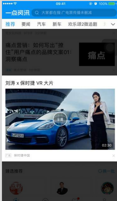
一点资讯360°全景信息流