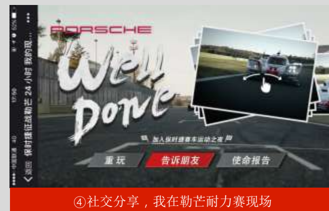
④社交分享，我在勒芒耐力赛现场