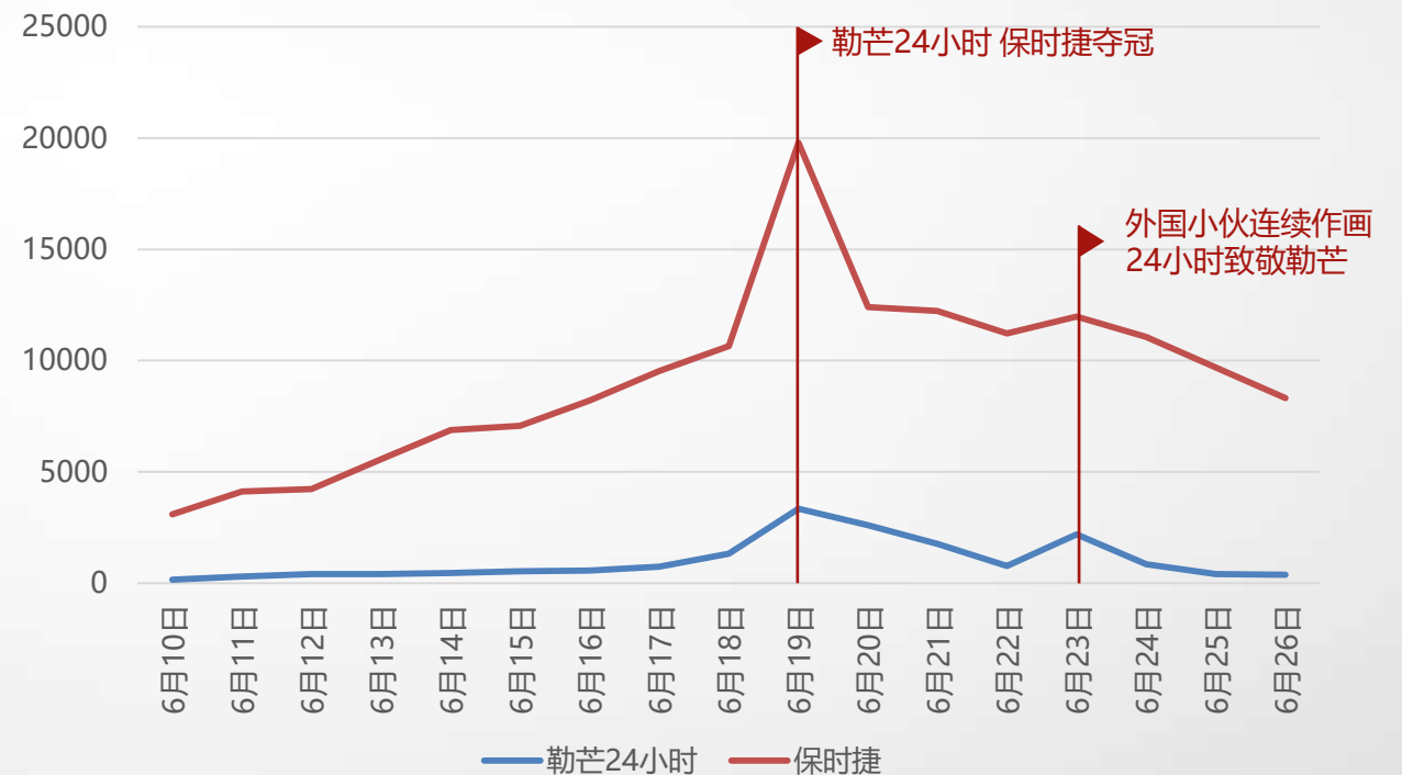
2017年6月“勒芒24小时” & “保时捷”关注度指数变化分布