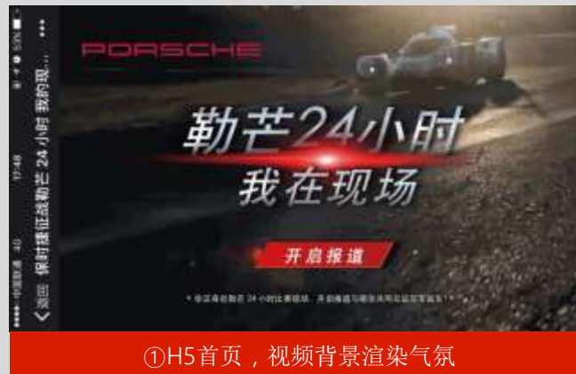
①H5首页，视频背景渲染气氛