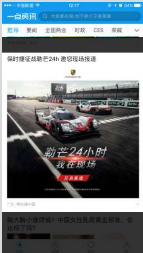
一点资讯原生画报