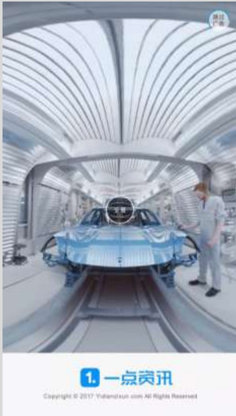
一点资讯360°全景开屏

利用体感互动技术，任意角度旋转视角，能多角度观察从第一辆保时捷到第一辆勒芒赛车，以及600余量保时捷新款限量跑车。体验驾驶保时捷跑车，驰骋跑道快感，使用户感受其独特设计，深化“生于赛道，驰于公路”的品牌认知。