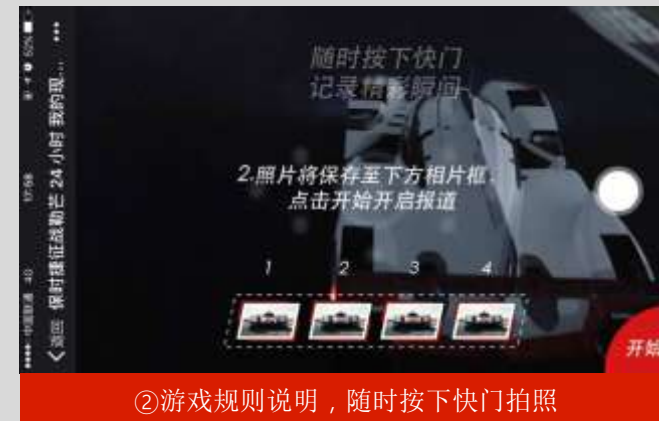
②游戏规则说明，随时按下快门拍照