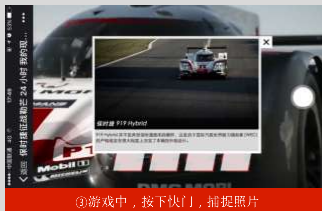
③游戏中，按下快门，捕捉照片