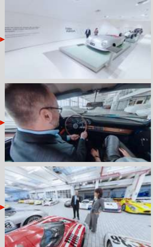
跟随刘涛探寻保时捷博物馆