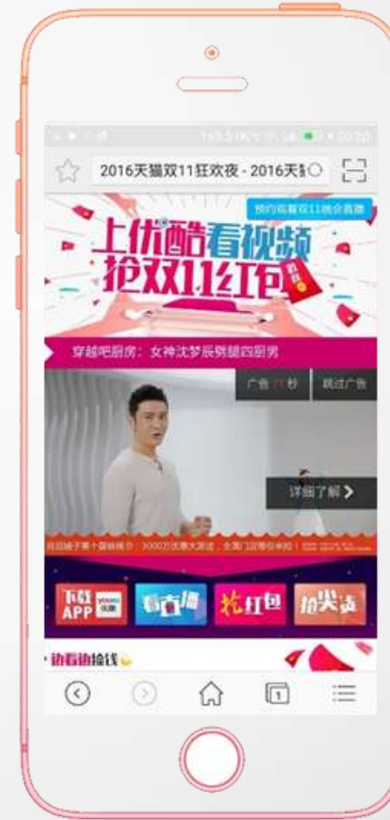
开屏-天猫优酷跳转页