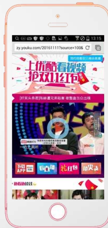
安卓 Push-天猫优酷跳转页 安卓 Push-天猫优酷跳转页