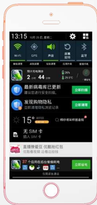
安卓 Push-天猫优酷 安卓 Push-天猫优酷