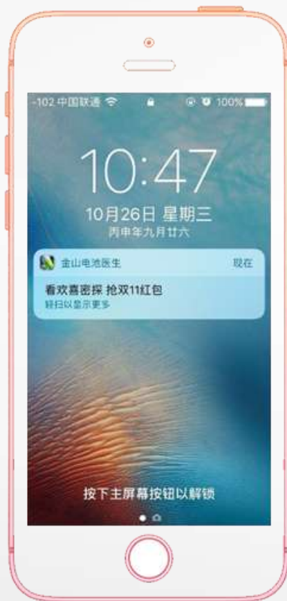
ios Push-天猫优酷 ios Push-天猫优酷