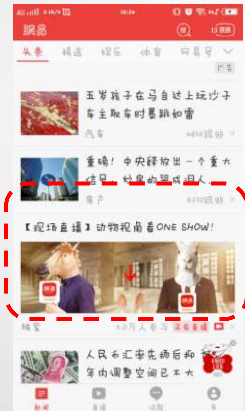
第一场 头条信息流第6条