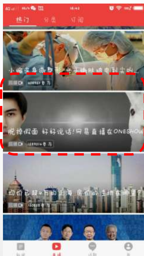
第二场 直播热门第五条