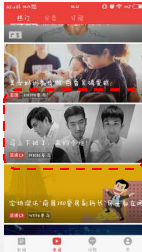
第三场 直播热门第三条