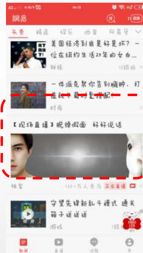
第三场 头条信息流第6条