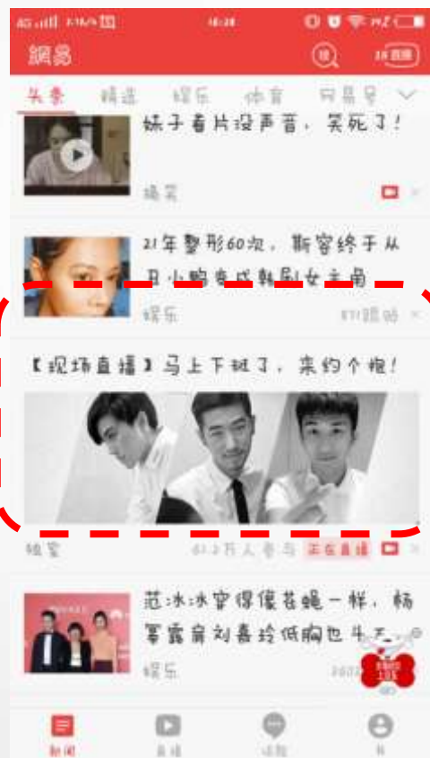
第二场 头条信息流第6条