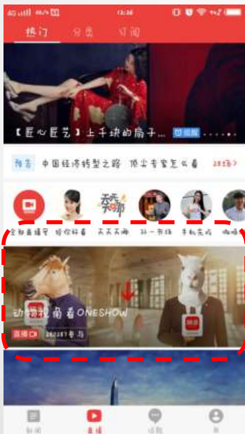
第一场 直播热门第一条