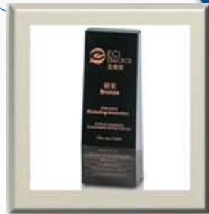
国际电商创新艾奇奖