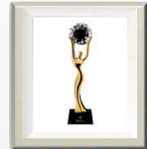
中国创新传播蒲公英奖