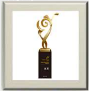
中国数字营销金鼠标奖