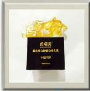
中国经典传播虎啸奖