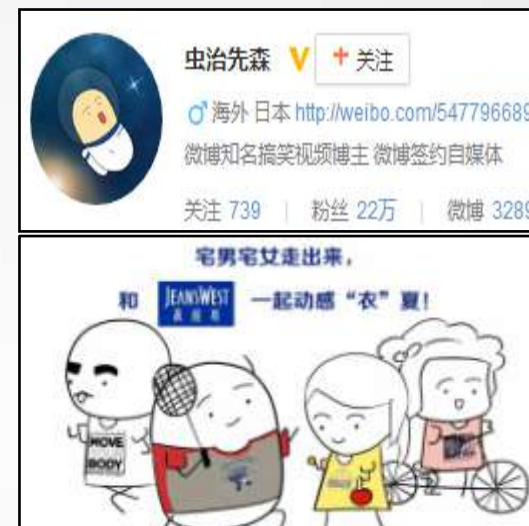
《如何让宅男更有活力》