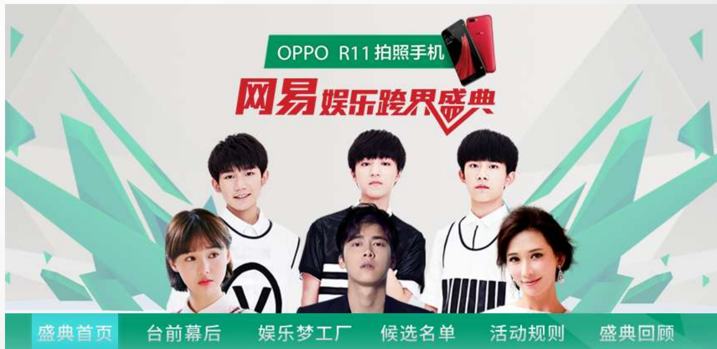
PC端网易网-娱乐跨界盛典专题