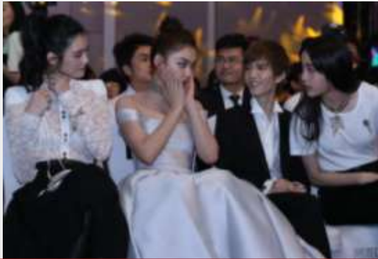
盛典现场明星比脸