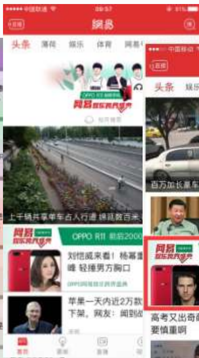
头条栏目首页下拉刷新