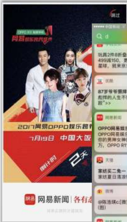
网易旗下多个APP开机