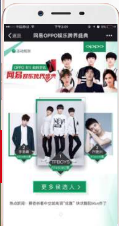
网易新闻客户端-娱乐跨界盛典专题