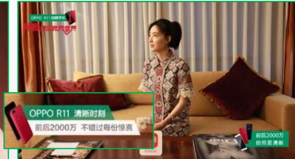
定制“清晰”卖点相关问题，明星讲述态度观点 OPPO卖点以tips形式无缝切入，让卖点感受更立体