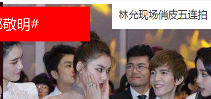
林允现场俏皮五连拍 笑称“从来没这么美过！”