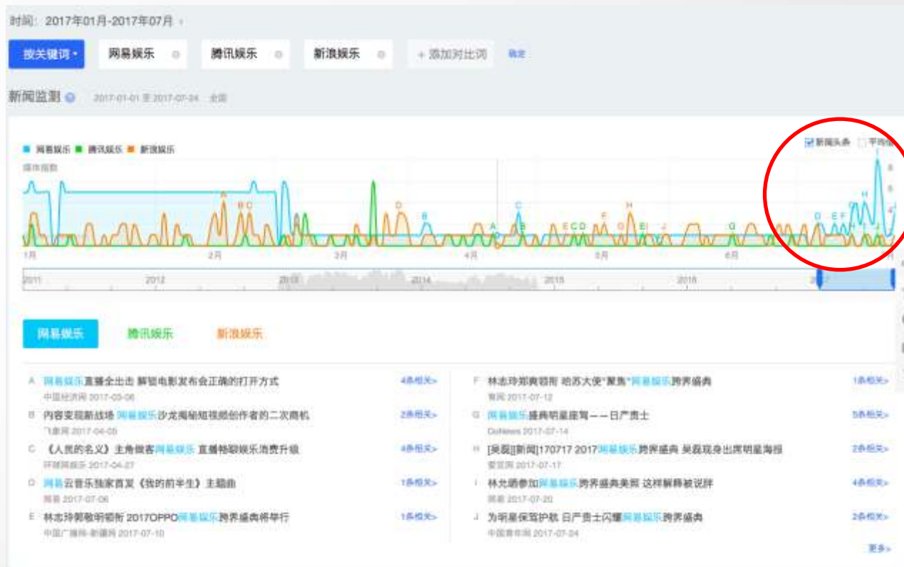
百度指数：超半年对比