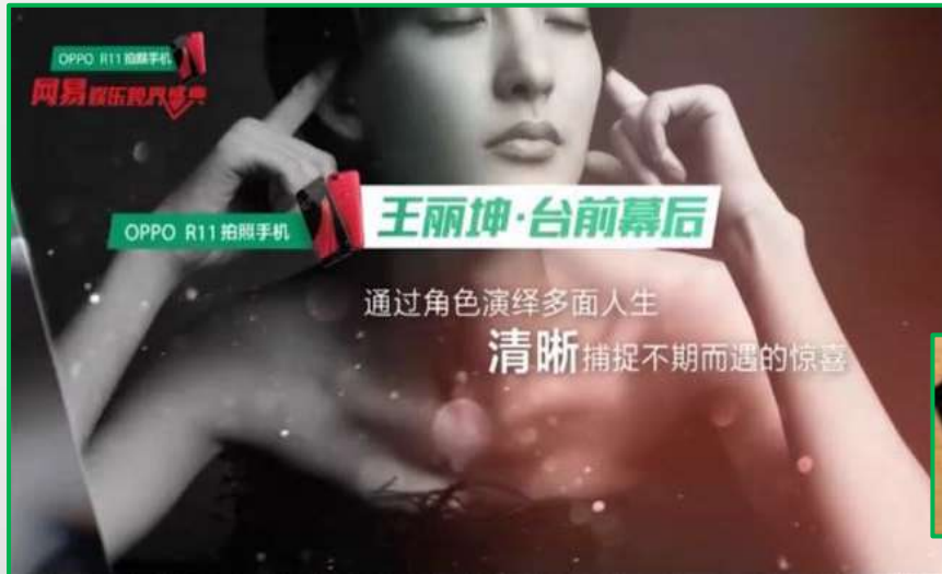
从“台前”到“幕后” 呼应OPPO的“前置”及“后置”镜头清晰卖点