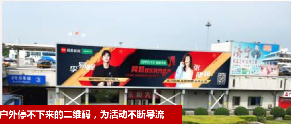
北上广深户外停不下来的二维码，为活动不断导流