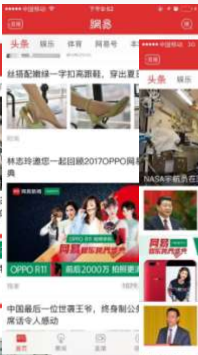
头条栏目第六条信息流全量