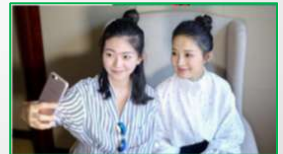
采访结束后 OPPO记录下明星瞬间，制造同框机会