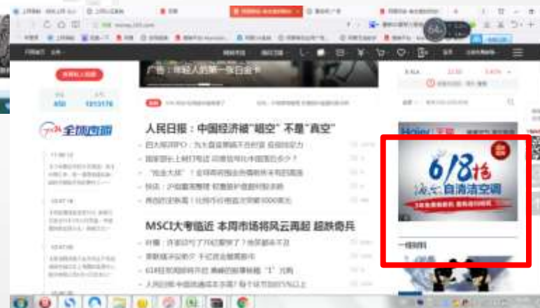
财经频道首页矩形M1