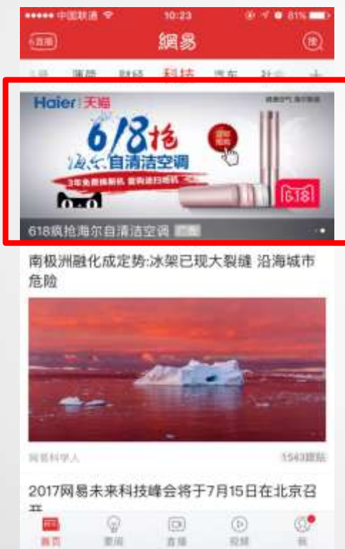
网易新闻客户端科技栏目 第2帧焦点图