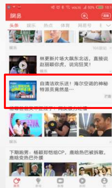
新闻客户端头条栏目 第17条信息流