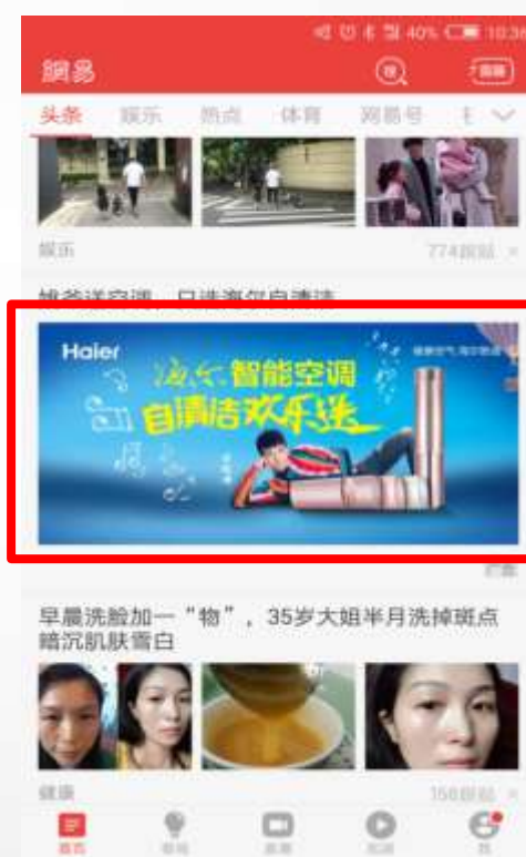
新闻客户端头条栏目 第4条信息流