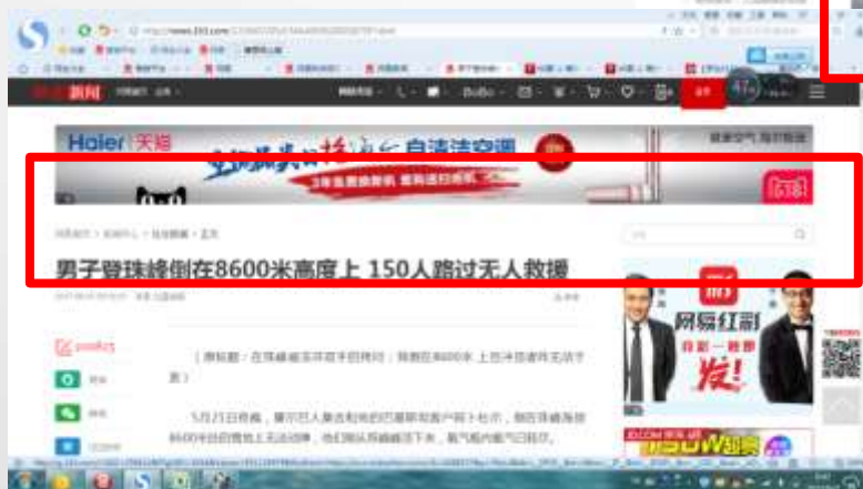
新闻频道文章页通栏