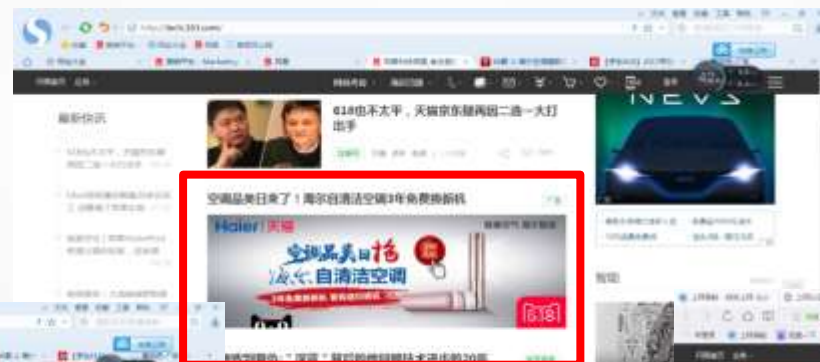
科技频道首页 信息流