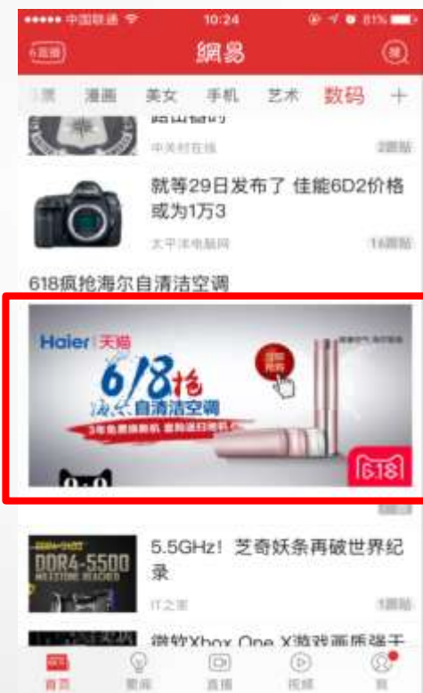
网易新闻客户端数码栏目 第11条信息流广告