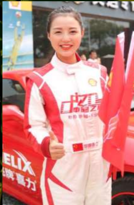
KOL现场助威 发表远征态度

12:20-12:40 以转播现场开幕式为主采 景；法拉利车队、牧马人 车队、球迷队伍、壳牌露 出特写、远征装备