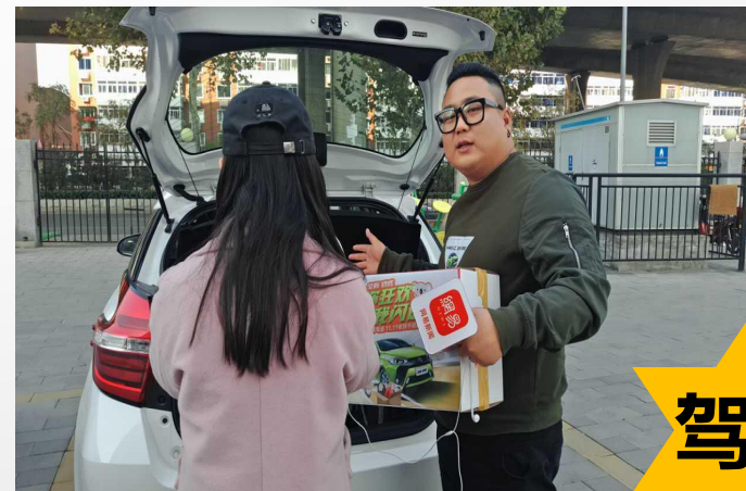
致炫tvc搞笑艺人小胖