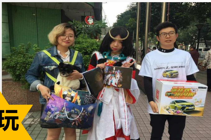
畅销网游网易阴阳师coser