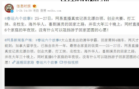
信息时报官微转发推荐