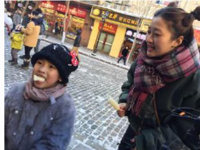
喜剧演员石蕊在零下二十度的哈尔滨吃冰棍