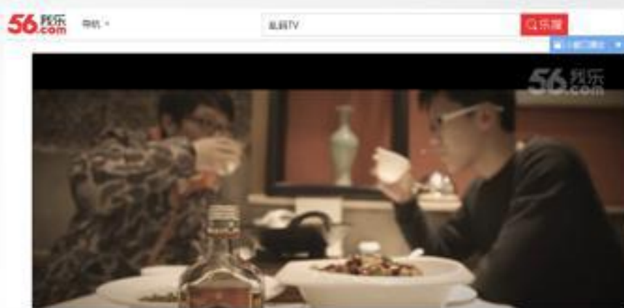
56网热门电影频道本周热门精选推荐