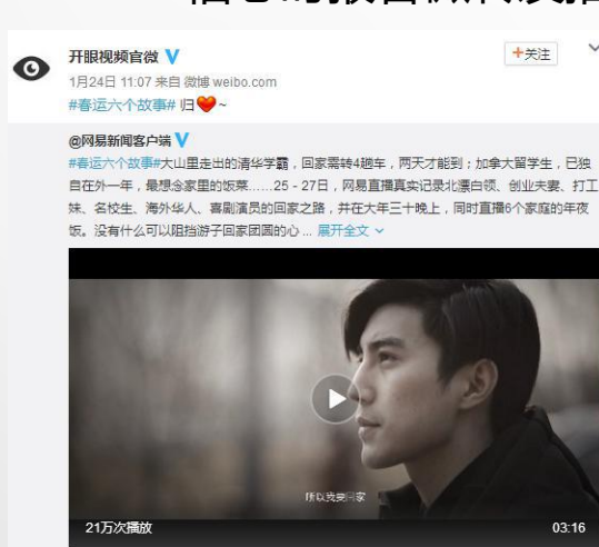
开眼视频官微转发推荐