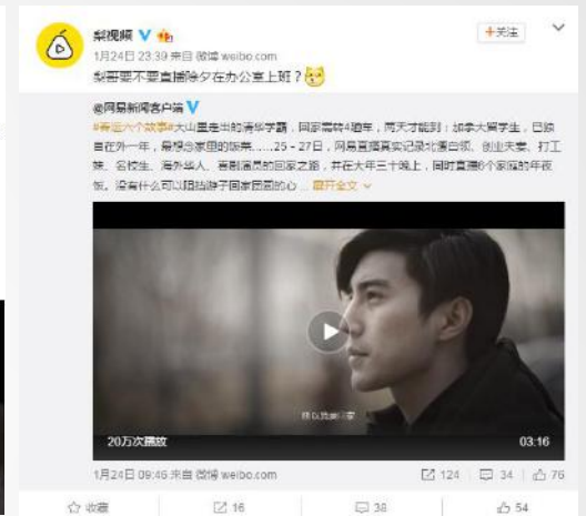
梨视频微博官微转发推荐