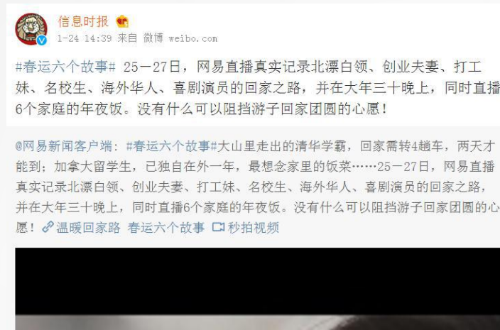
信息时报官微转发推荐