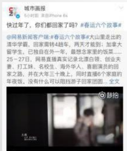
城市画报官微转发推荐