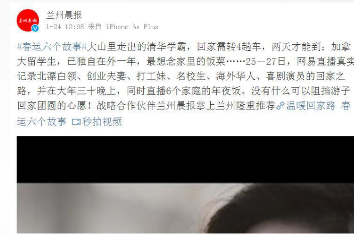
兰州晨报官微推荐