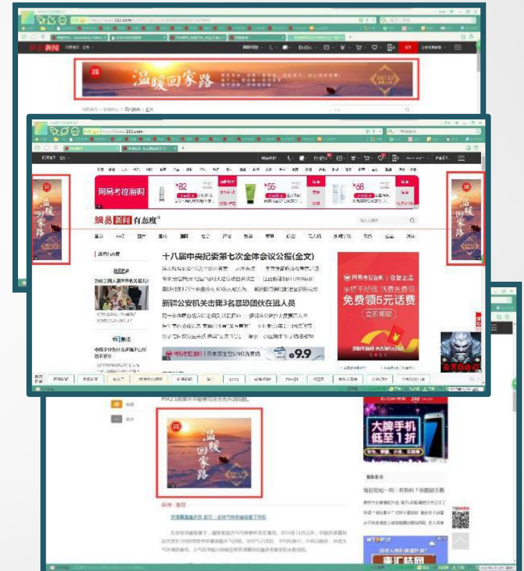
网易新闻门户网站