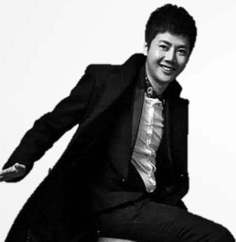
创意劲客 同道大叔 知名星座博主