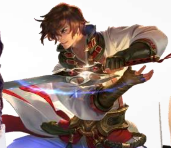
激情劲客 王者荣耀菌 知名游戏博主 微博游戏视频自媒体