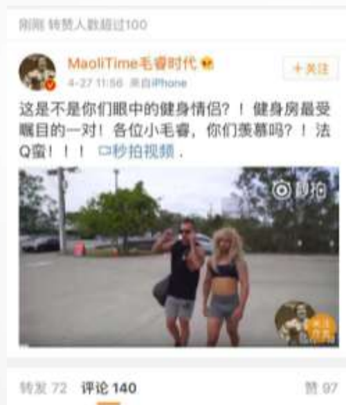
转发东风日产段视频微博 并发表自己的“劲客青年宣言”