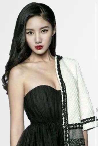
元气劲客 吴优 知名女演员

5月4日-5月8日-明星+KOL转发微博发布宣言，营造全民参与热度，带动网友参与