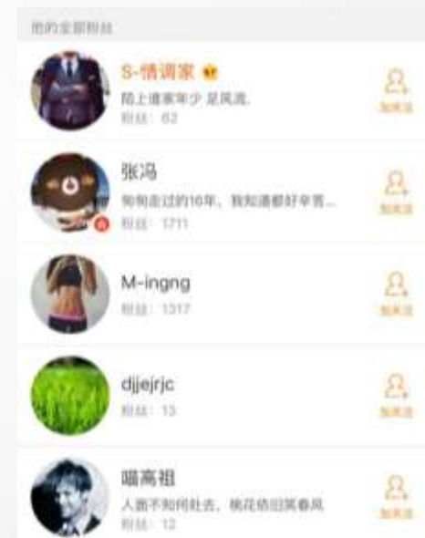
触达个人粉丝 引导粉丝关注话题与参与互动