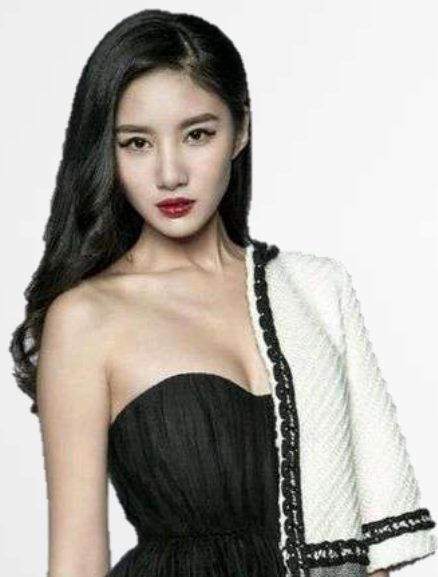
元气劲客 吴优 知名女演员

5月4日-5月8日-明星+KOL转发微博发布宣言，营造全民参与热度，带动网友参与