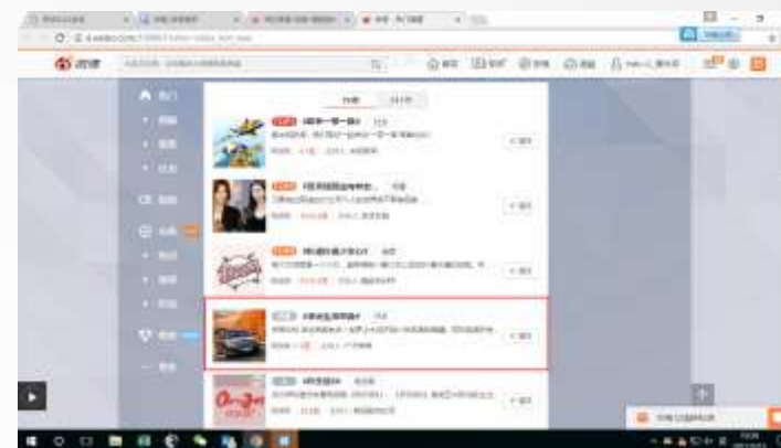
PC端话题页热门话题榜五轮播推荐