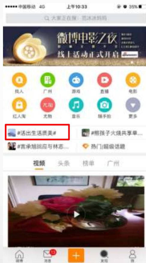
手机微博客户端广场页推荐话题五轮播文字链