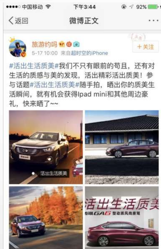
知名旅行家 旅游约吗