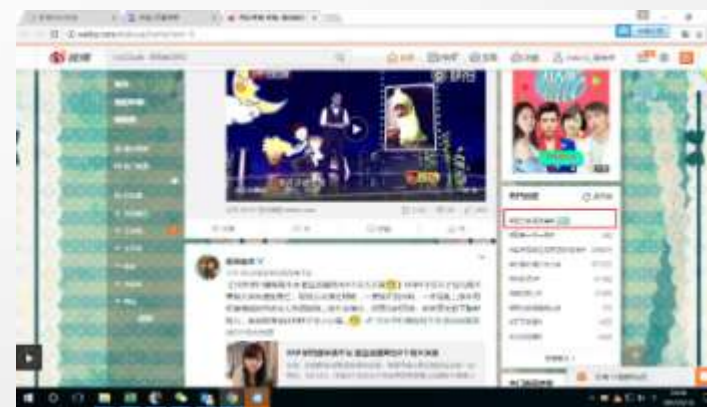
微博首页推荐话题五轮播文字链