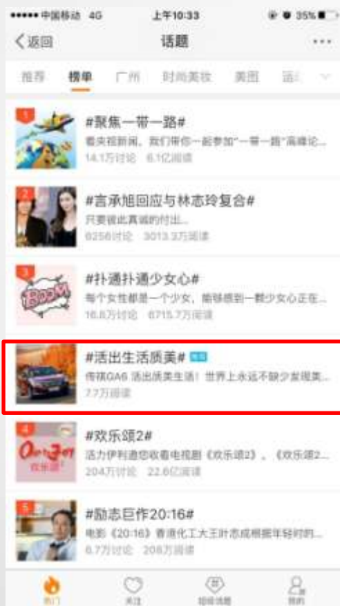
移动端话题页热门话题榜五轮播推荐