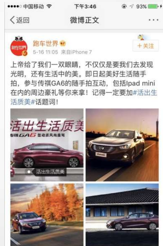
资深汽车达人 跑车世界