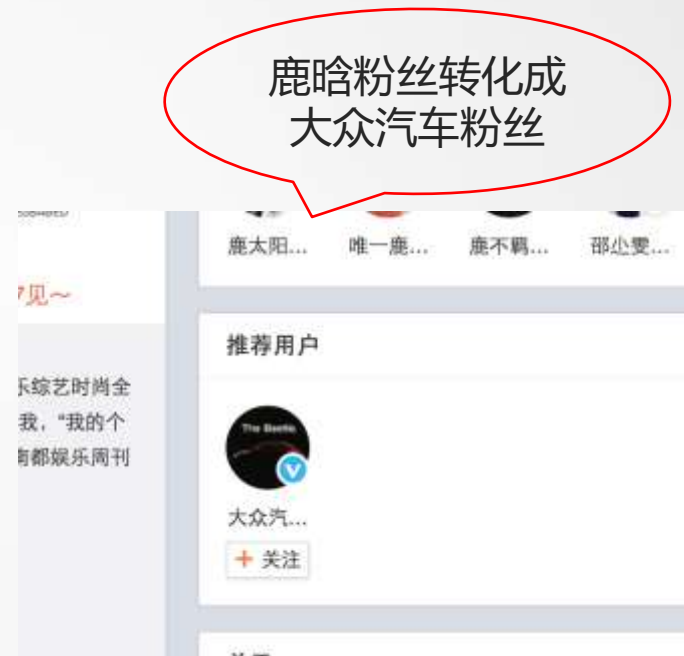
2016鹿晗愿望季PC&移动端推荐微博账号