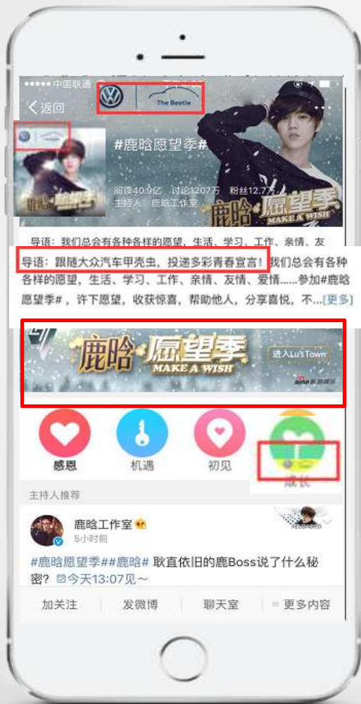
2016鹿晗愿望季微博热门话题权益体现