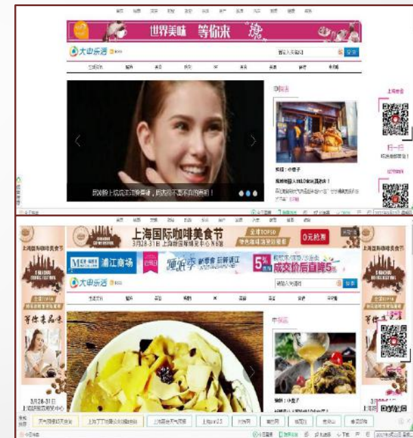
大申网乐活频道顶部&全景通栏广告