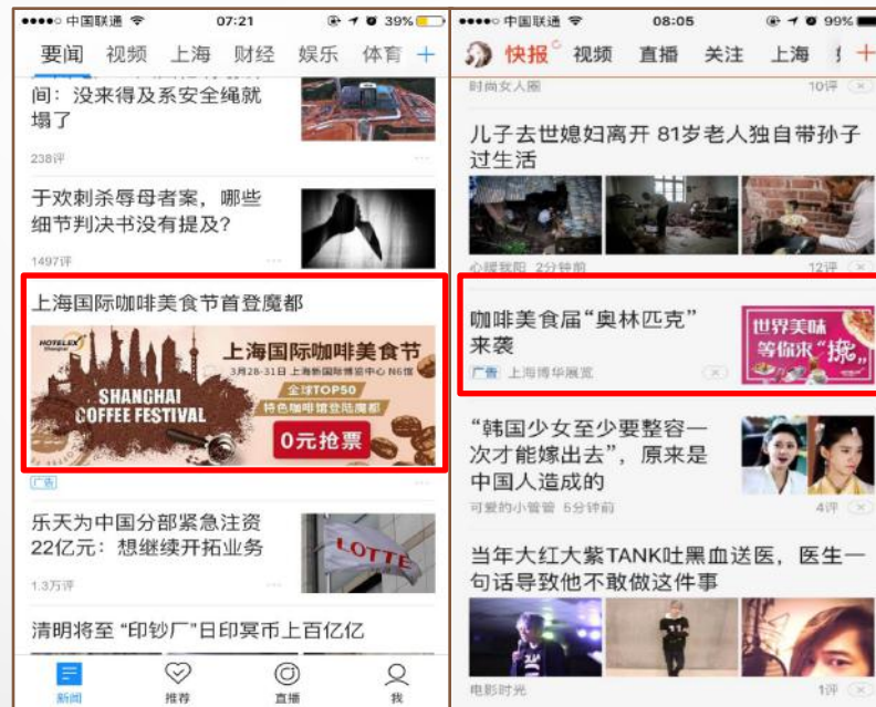
腾讯APP、天天快报APP定向信息流广告