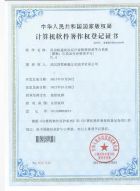
映盛化妆品行业数据管理平台系统