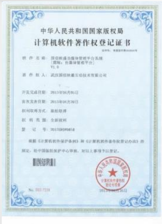
映盛自媒体管理平台系统