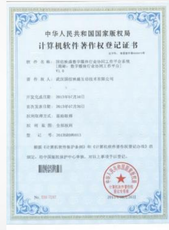
映盛数字媒体行业协同工作平台系统