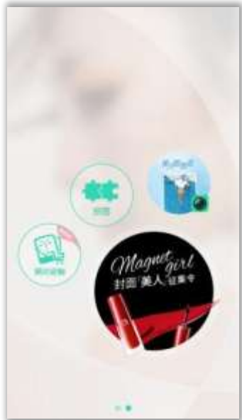
美人相机首页通道