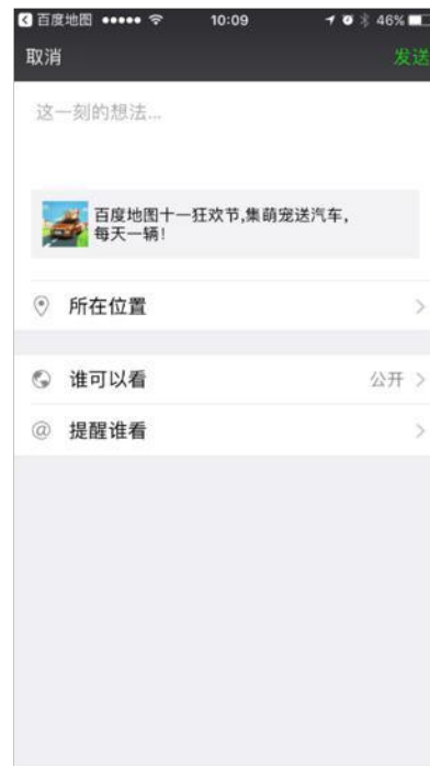
告别封闭,超轻松分享