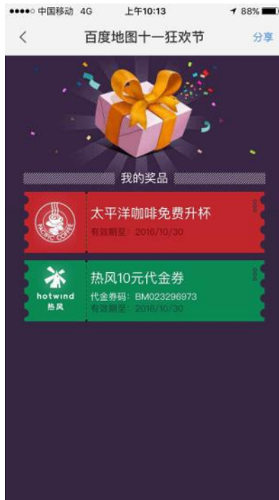
线下引流模式初尝试