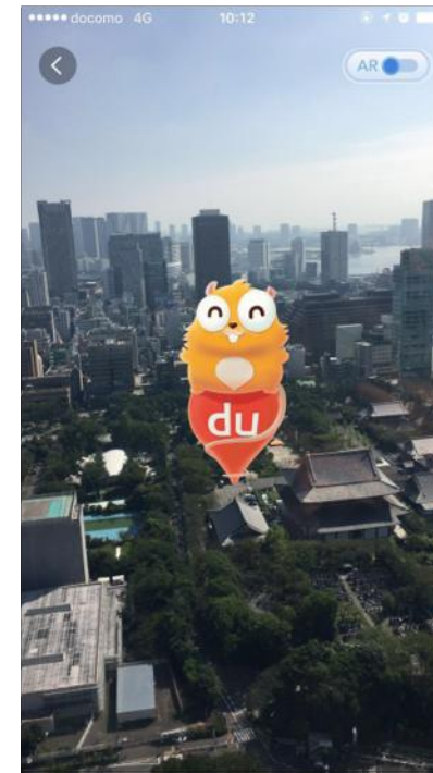
日本、台湾也可参与