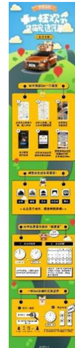
北京现代自制集生肖攻略