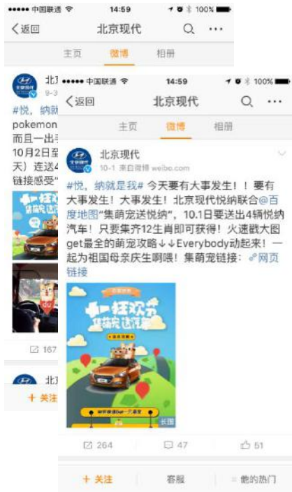
北京现代官方微博发稿