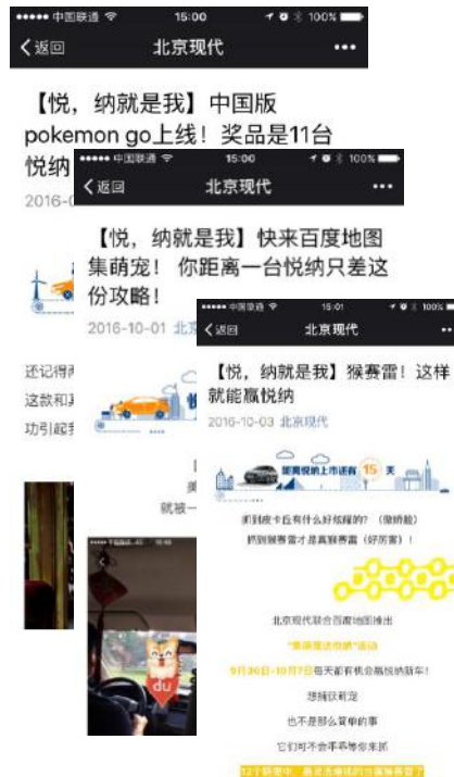
北京现代官方微信发稿