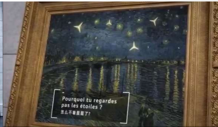
点击星空触发后续情节发展