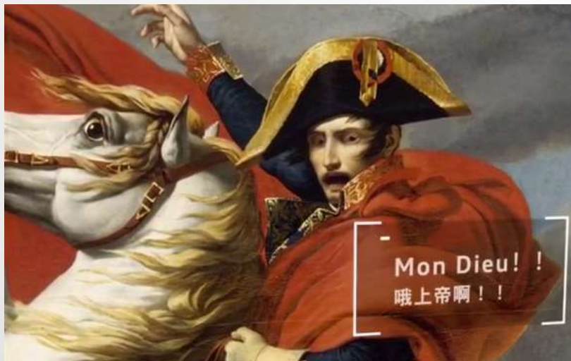
拿破仑生动的惊讶表情让人会心一笑

80、90的年轻群体更易接受有趣的形式 奥迪A5在与名画互动时的幽默场景更容易受到年轻人的追捧