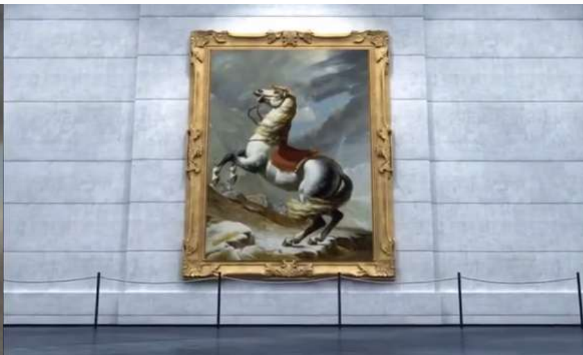
弃马驾车的动作十分幽默