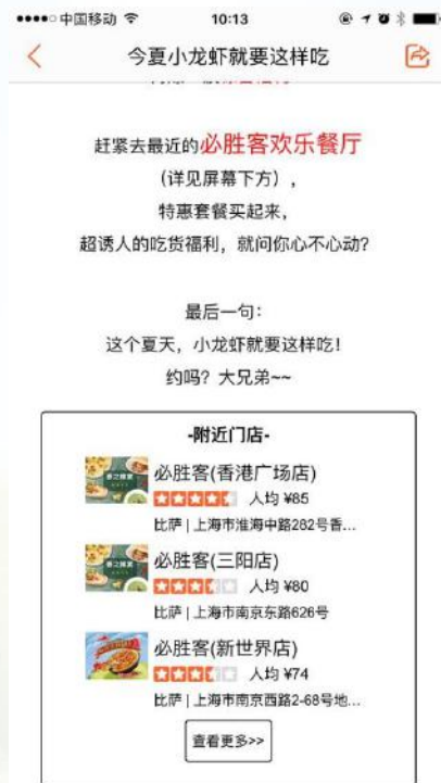
大众点评APP发现页头条入口、“小龙虾/比萨”关键词搜索活动入口