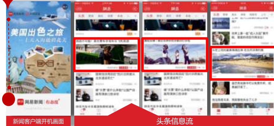
新闻客户端开机画面