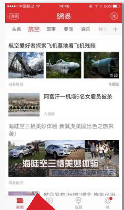
航空频道 大图信息流