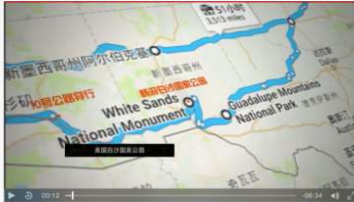
海陆空三栖美妙体验 新福特翼虎美国出色之旅 航空频道 646"