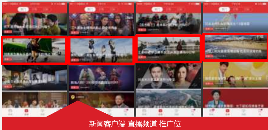
新闻客户端 直播频道 推广位