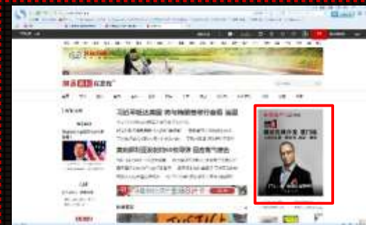
新闻频道-频道首页-->第一屏-焦点图(其中一帧)