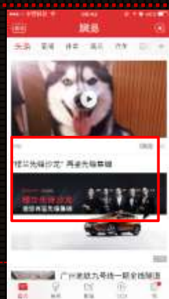
网易新闻客户端-推荐栏目(原头条栏目)->第4条-信息流广告