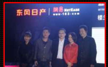
合影留念：多方高层与嘉宾合影留念。