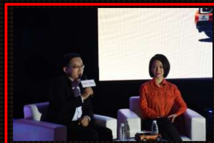
互动沙龙环节：嘉宾、日产高层、主持人进行沙龙互动，在轻松愉悦的氛围中，植入日产品牌内容。