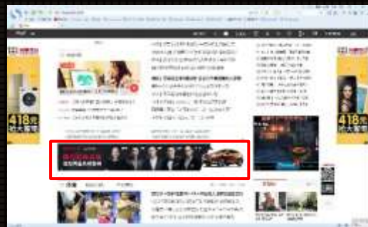
网易首页-01通栏位置-通栏广告(1/4轮替)