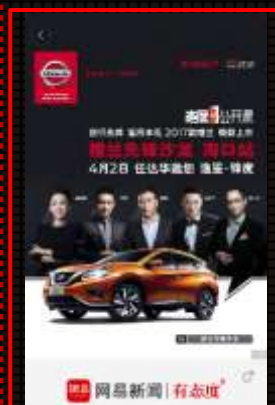
网易新闻客户端-启动页-启动页面