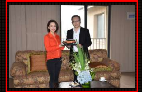
VIP休息室：嘉宾与日产高层VIP休息室互动，日产高层为嘉宾赠送楼兰车模，形成活动二次传播素材。