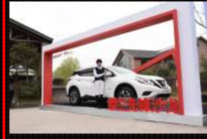
展车欣赏环节：全程安排展车区域，体现楼兰品牌高端调性，摆放至人流密集区域，最大化品牌露出