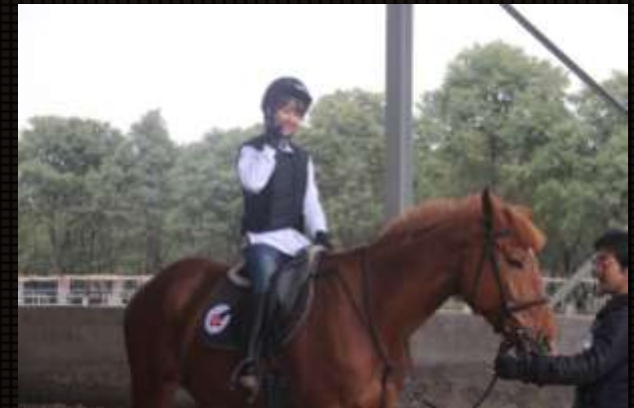
车主在专业教练带领下驰骋马场