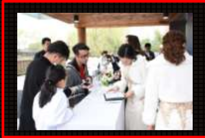
签到环节：车主签到台签到、签名墙签名并领取活动精美礼品。 车主人数：38