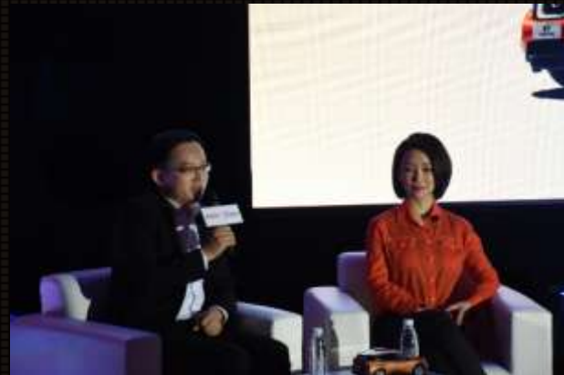
东风日产代表与潘晓婷进行沙龙交流