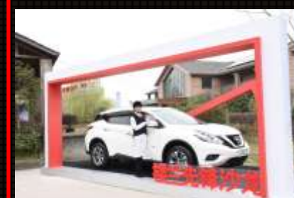
拍照互动环节：在展车区设置模特合影互动，体现品牌元素，在二次传播的基础上扩大品牌露出。