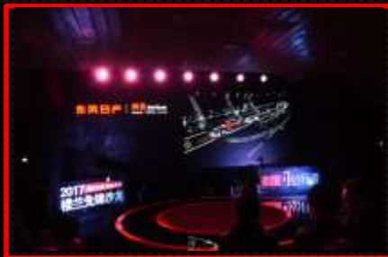
暖场环节：暖场环节，播放日产品牌TVC，品牌权益调性充分露出。