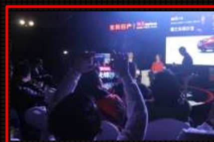
车主提问环节：互动沙龙末期进行车主提问环节，现场车主提问嘉宾&日产高层，植入日产品牌内容。