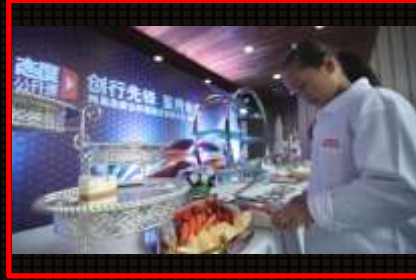
茶歇环节：车主签到完毕可享用活动精美茶歇。