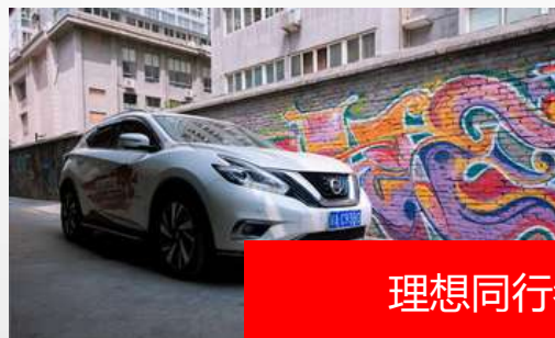
理想同行者-东风日产SUV家族