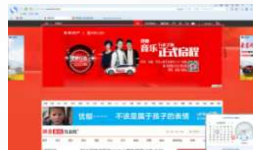
新闻首页全屏下推