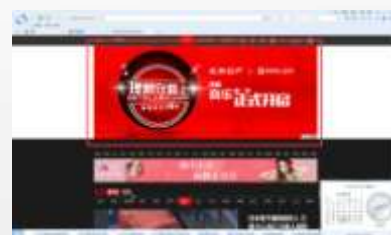
新闻时事组全屏下推