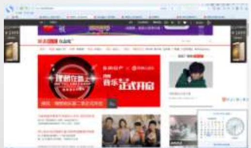
娱乐频道首页焦点图