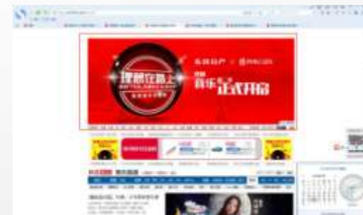
娱乐组合全屏下推