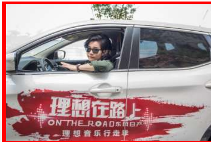
第二站 大理 独立唱作人-李霄云