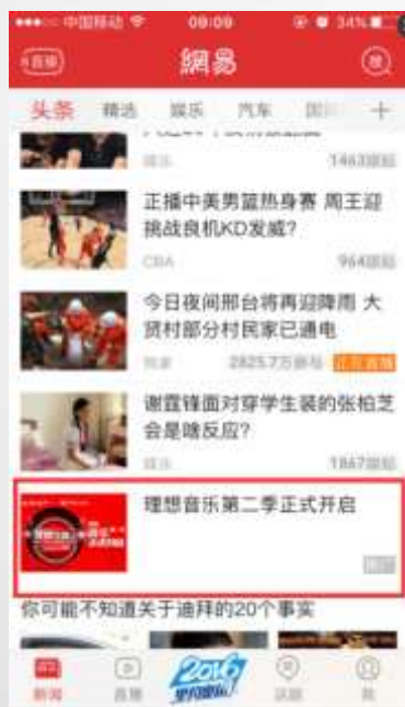
新闻客户端 头条第11条信息流