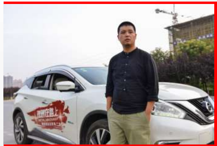
第三站 西安 民谣音乐人-马頔