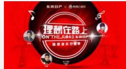
● 2016 理想行走季