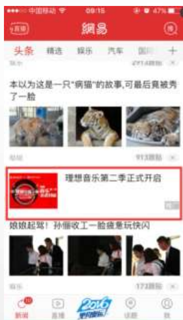
新闻客户端 头条第17条信息流