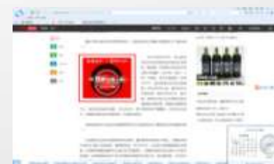
新闻文章页画中画02