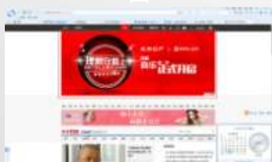
新闻组合全屏下推