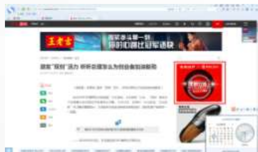
新闻内页画中画A 2轮替