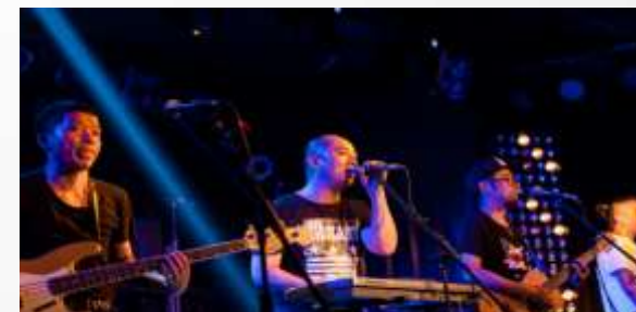
陕西方言摇滚乐队-黑撒乐队