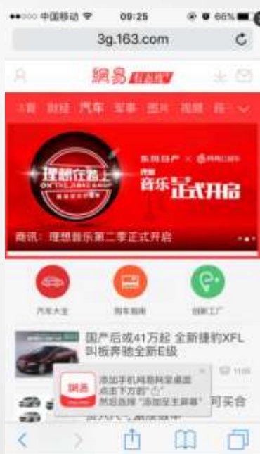
手机网 汽车第2帧焦点图