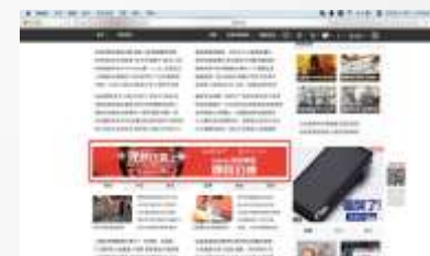
网易首页02通栏 4轮替