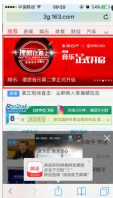
手机网 首页第4帧焦点图