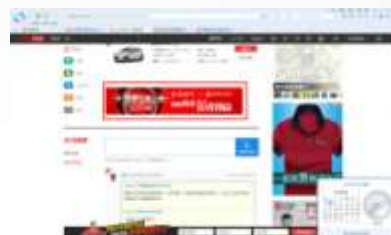
汽车文章页画中画02