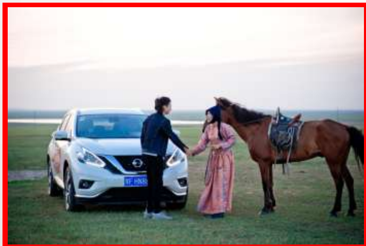
第一站 呼伦贝尔 原创音乐人-霍尊

8月，东风日产SUV家族携手三大明星导师霍尊、李霄云和马頔，分别走进三个与音乐有着深厚渊源的城市——呼伦贝尔、西安和大理，寻访了当地的城市理想音乐人。