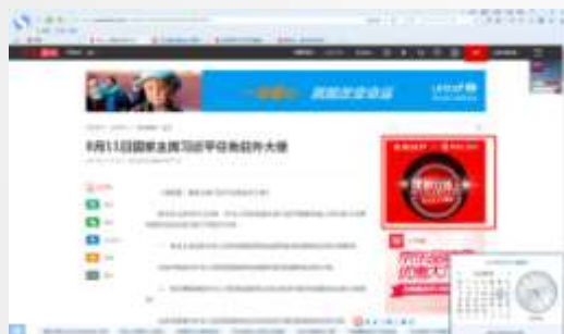
新闻文章内页画中画A