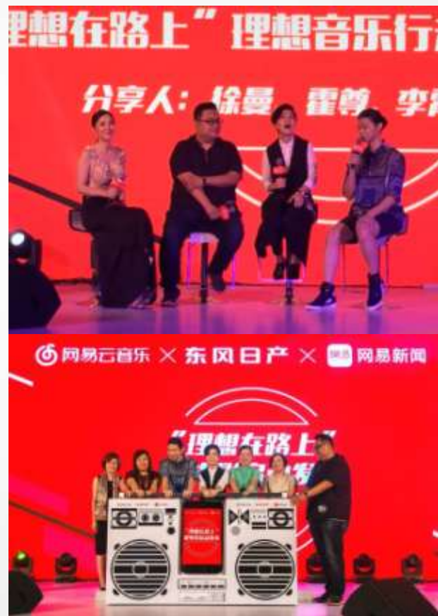
嘉宾分享&启动仪式