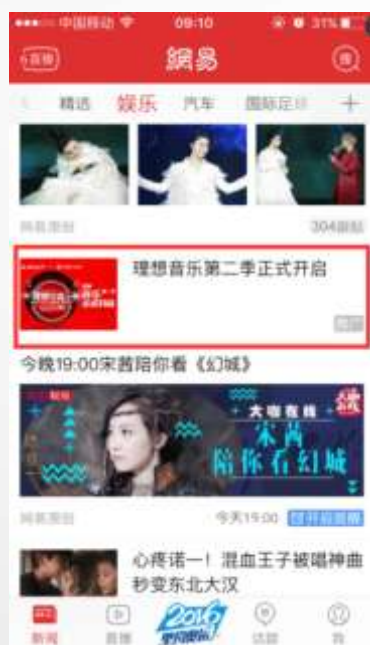
新闻客户端 娱乐第11条信息流