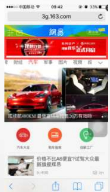
手机网 汽车栏目顶通