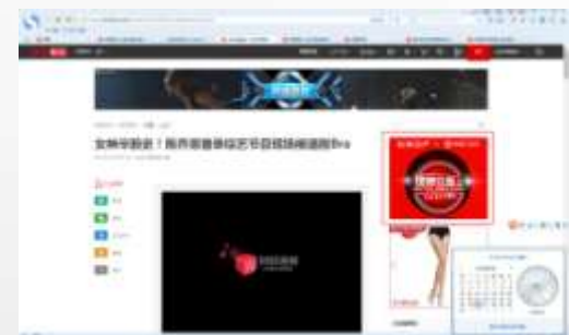
娱乐文章内页画中画A