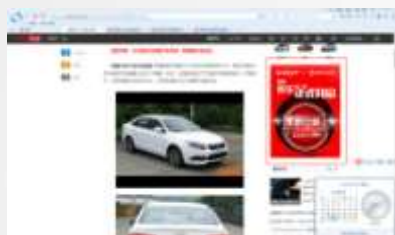
汽车文章内页擎天柱