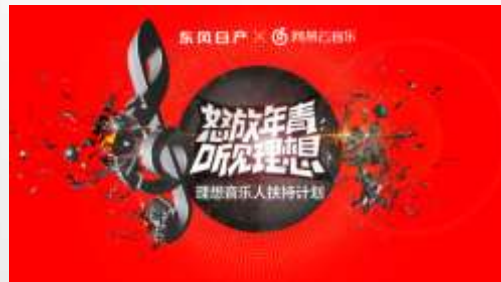
● 2015 理想音乐人扶持计划

东风日产品牌年轻化营销之下，“理想”是品牌与年轻群体沟通重要的关键词。2015年理想音乐第一季大获成功，2016年第二季，品牌作为理想同路人再度出发。