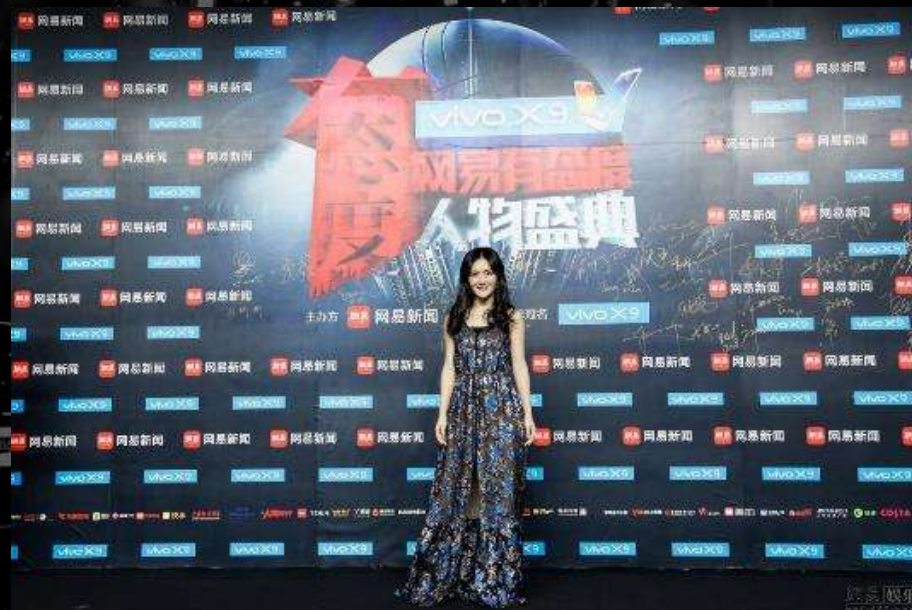
红毯区-背景板签到区