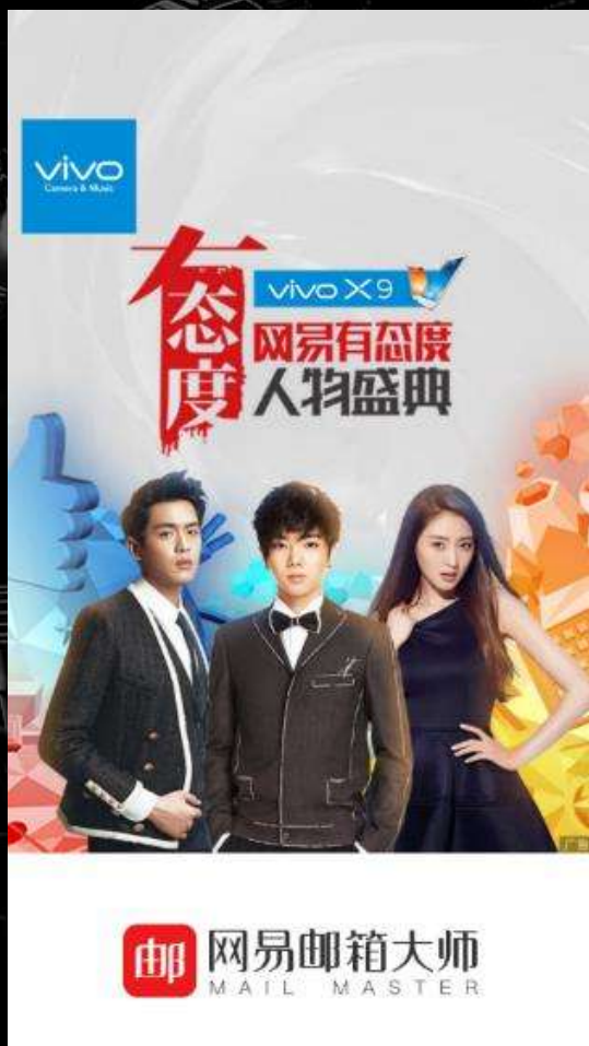
邮箱大师开机画面