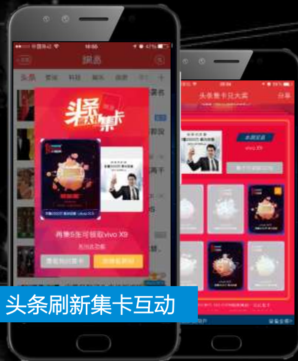
头条刷新集卡互动