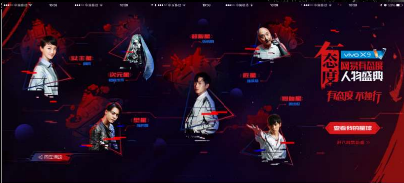
新闻客户端静态长引导页