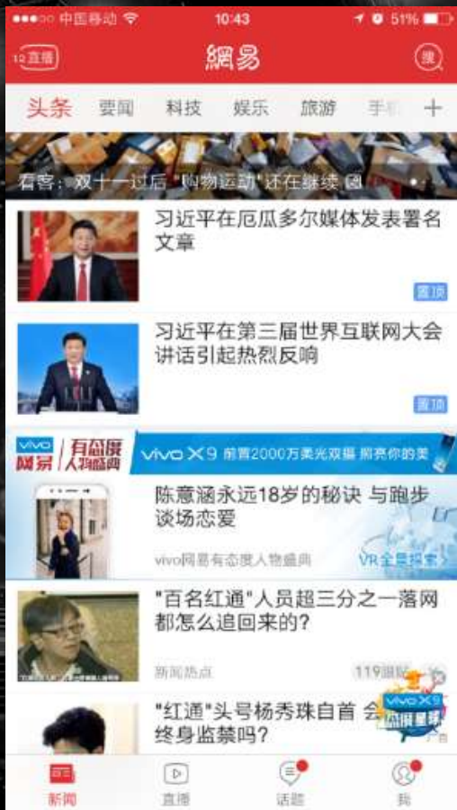
第2条信息流-定制看板