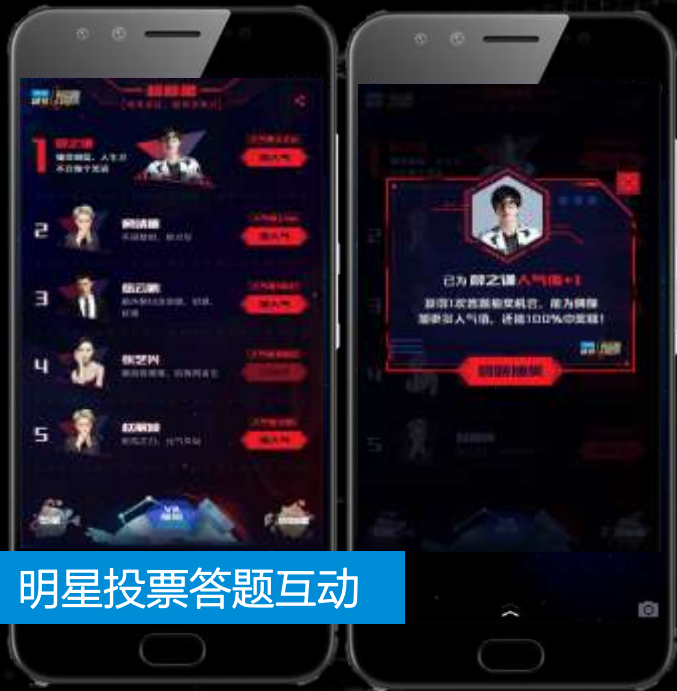
明星投票答题互动