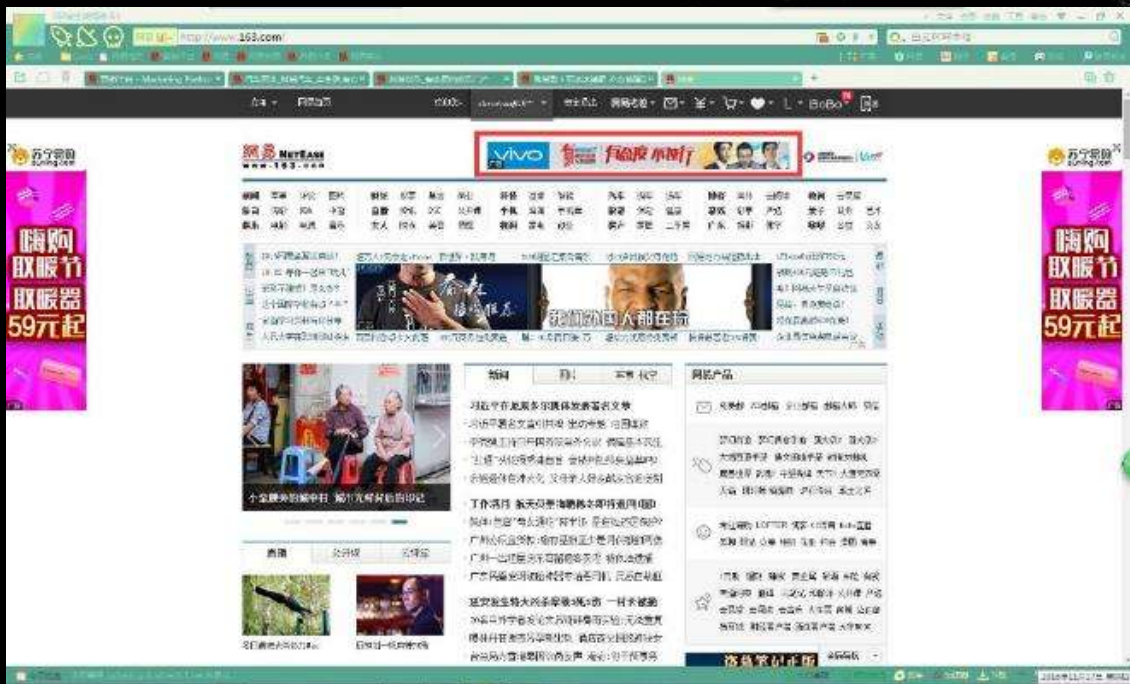
网易首页V领域触发前