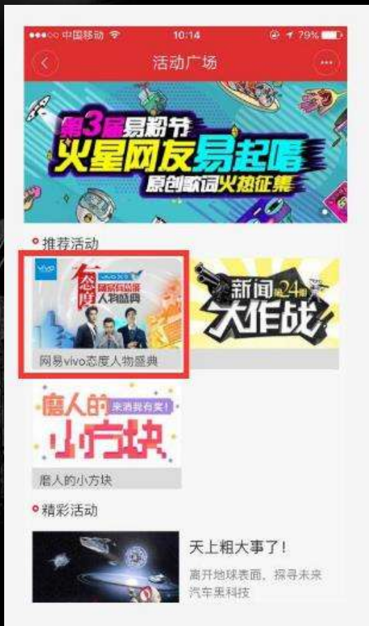
活动广场-活动推荐