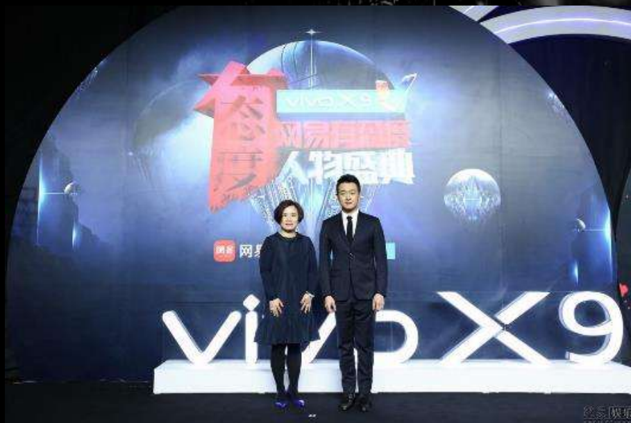
红毯区-合影拍照区

舞台每一处都融入vivo品牌利益，同时更专门开辟180°“vivo照亮你的美”自拍台，明星与品牌自拍亮相