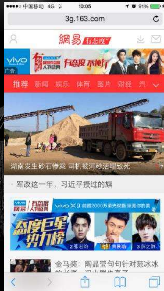
手机网首页-顶部通栏