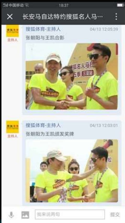
搜狐新闻客户端直播间