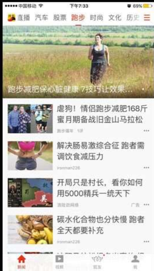
搜狐新闻客户端跑步频道

搜狐新闻客户端首先是行业领先的新闻资讯平台，为广大用户第一时间提供最新鲜的新闻资讯。通过跑步等细分频道和用户订阅为用户提供个性化新闻。