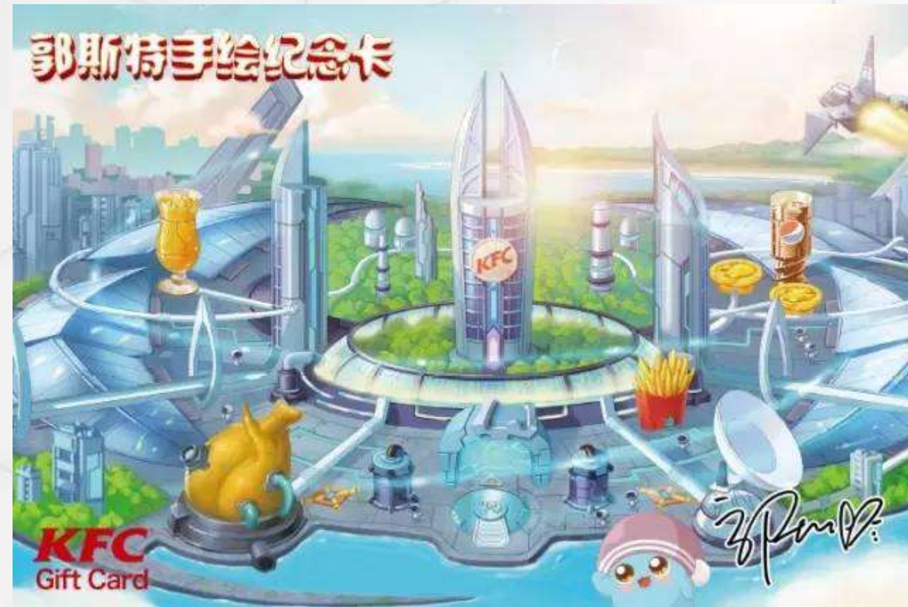
限量版手绘纪念卡

为了和90后、00后的消费者产生更强的共鸣，品牌特别邀请人气漫画家郭斯特，为四大奇葩绘制四大岛屿（炸鸡岛、甜品岛、早餐岛、小食岛），并在直播前期邀请消费者为各自喜爱的产品站队，炒出声量。