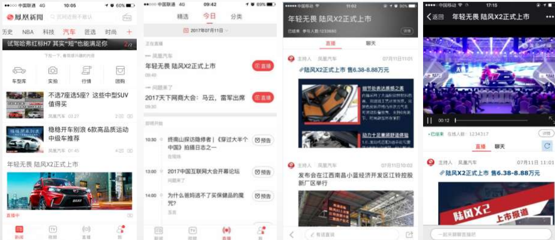
汽车频道信息流以及直播频道推广入口