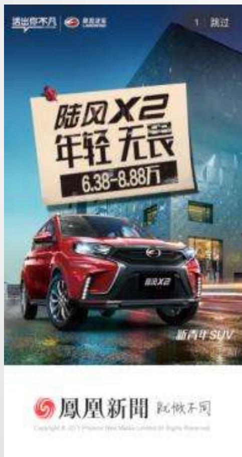
凤凰新闻客户端封面股事/头条信息流/焦点图/手风信息流推广截图