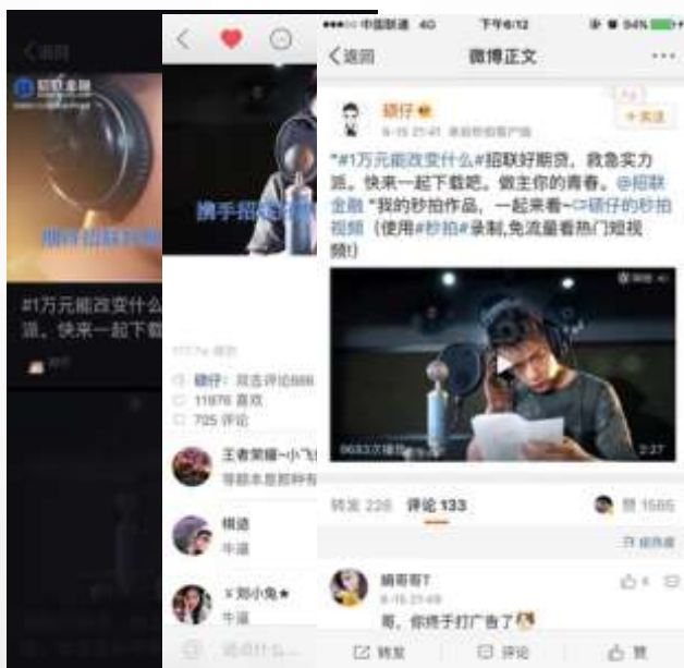
硕仔 (快手 + 秒拍 + 微博)