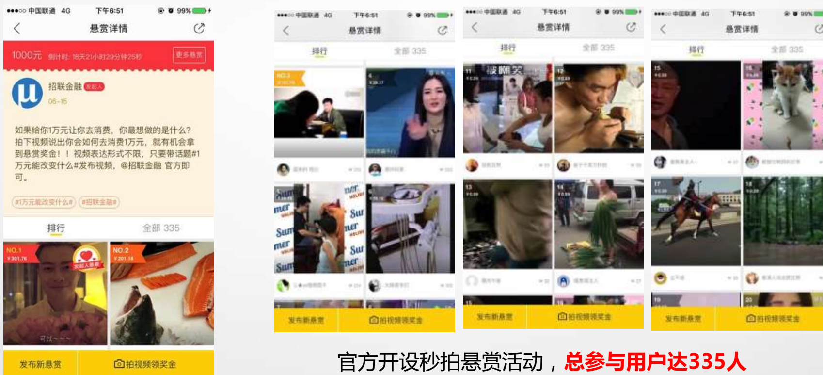
官方开设秒拍悬赏活动， 总参与用户达335人

为了吸引更广泛的关注，招联金融官方在秒拍发起悬赏活动，只要用户发布#1万元能改变什么#话题视频，说出自己最初的梦想就有机会获得悬赏奖金。这引发了大量用户参与创作，有效的促进了话题的传播。