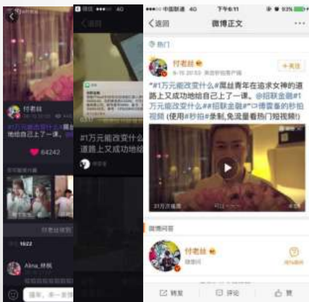
付老丝 (美拍 + 秒拍 + 微博)